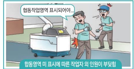
협동작업영역 미 표시에 따른 작업자 외 인원이 부딪힘