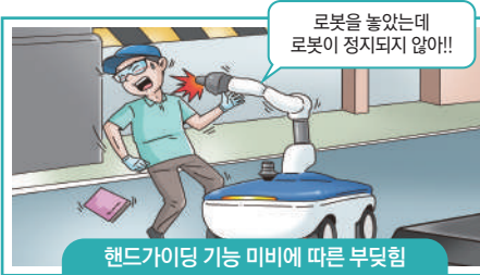
핸드가이딩 기능 미비에 따른 부딪힘