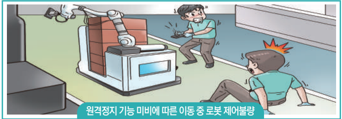
원격정지 기능 미비에 따른 이동 중 로봇 제어불량