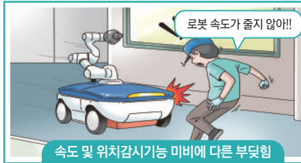
속도 및 위치감사기능 미비에 따른 부딪힘