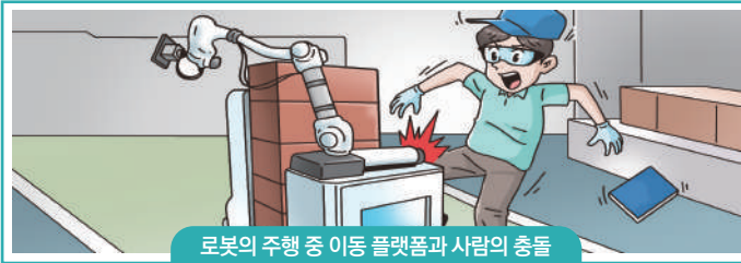
로봇의 주행 중 이동 플랫폼과 사람의 충돌